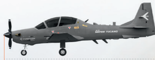
11,38 M (37 FT 4 IN)