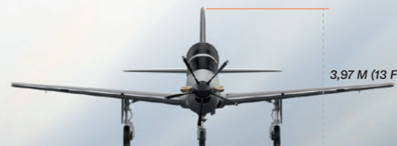
3,97 M (13 FT)