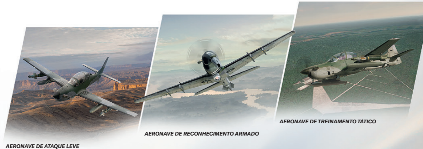
AERONAVE DE ATAQUE LEVE