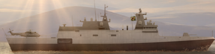
FRAGATAS LIGERAS CLASE TAMANDARÉ